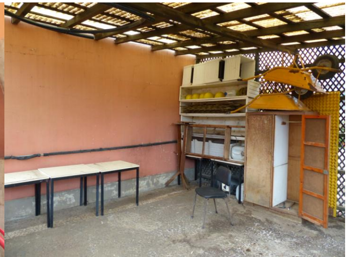
A estufa antes das recomendações da equipa do I.A. Saúde