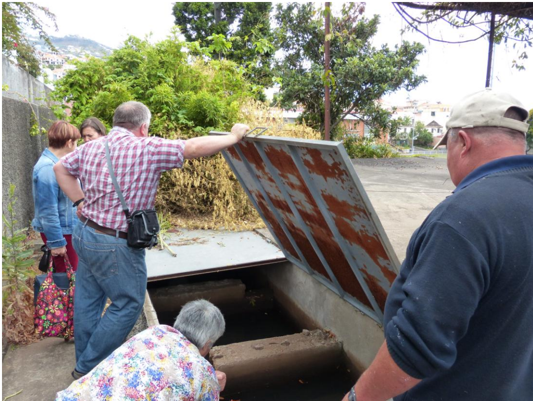
Visita dos técnicos de saúde ambiental do I. A. da Saúde com o objetivo de monitorizar e identificar possíveis criadouros, através da recolha de amostras.