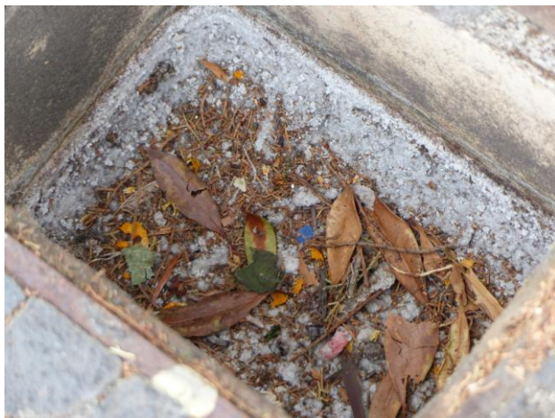
A estufa depois das recomendações da equipa do I.A. Saúde