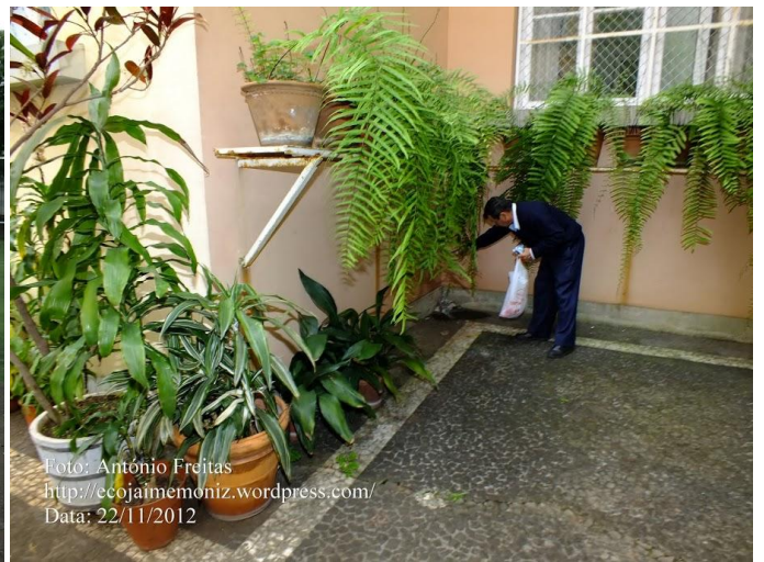
Data: 22/11/2012