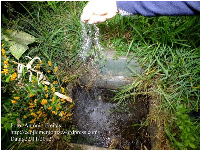
Data: 22/11/2012