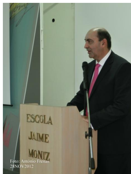
28NOV2012