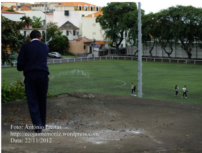
Data: 22/11/2012