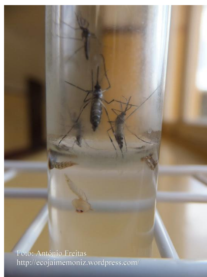
Ciclo de desenvolvimento do mosquito (Trabalho de investigação em ecologia da turma 35, do 11º ano.)