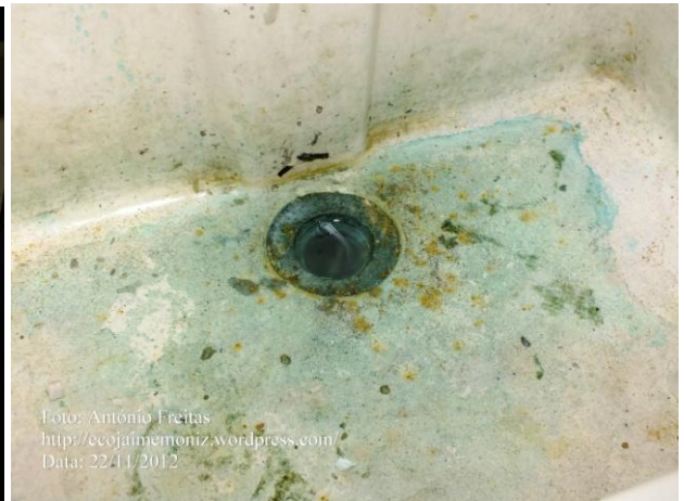
Data: 22/11/2012