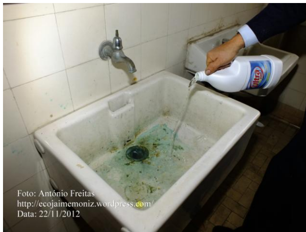
Data: 22/11/2012