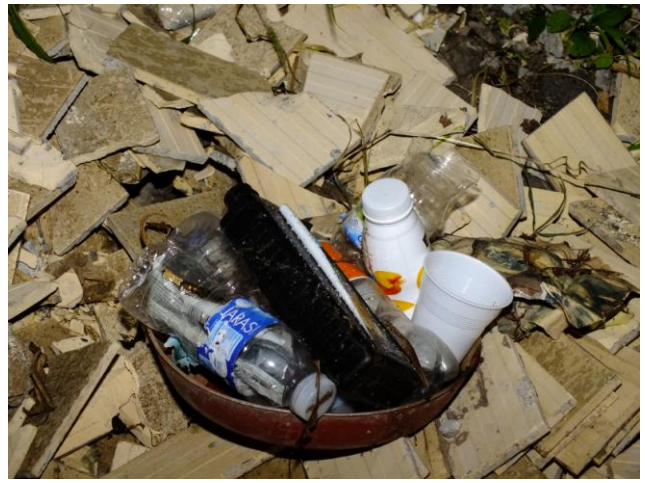
Limpeza de resíduos